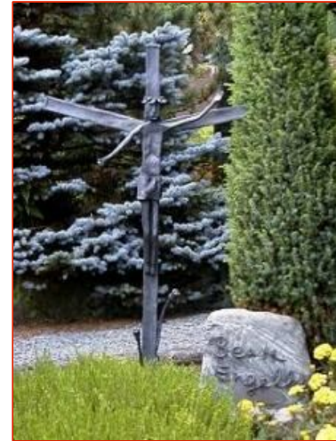
Grabzeichen mit Licht

Das Kreuz wurde aus Stahl geschmiedet und mit einer Graphitfarbe behandelt und die Grabschrift anhand der Unterschrift der Verstorbenen gefertigt.