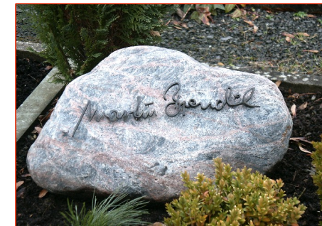
Handschrift des Verstorbenen in Schmiedebronze umgesetzt.