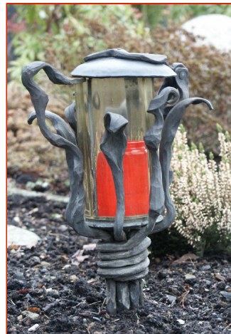
Grablicht aus Bronze

Ein Grablicht kann auch ein individuelles Zeichen sein. Als Beispiel ist hier eine organische Bronzeleuchte mit Blattwerk dargestellt. Alternativ sind auch klare Formen möglich.