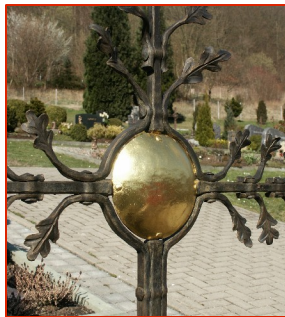
Detail aus einem Bronzekreuz

Der Stamm besteht aus farblich behandeltem Stahl. Das Relief wurde aus einer Bronzelegierung heraus getrieben.